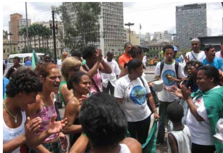
Panelaço em frente a Prefeitura pela ampliação da coleta em 2006

A sentença em questão pode ter efeitos a curto e longo prazo. De imediato, espera-se constituição do Conselho Gestor do qual, o Movimento Nacional dos Catadores de Materiais Recicláveis já requisitou à Secretaria de Serviços do Município de São Paulo, em 04 de maio, a