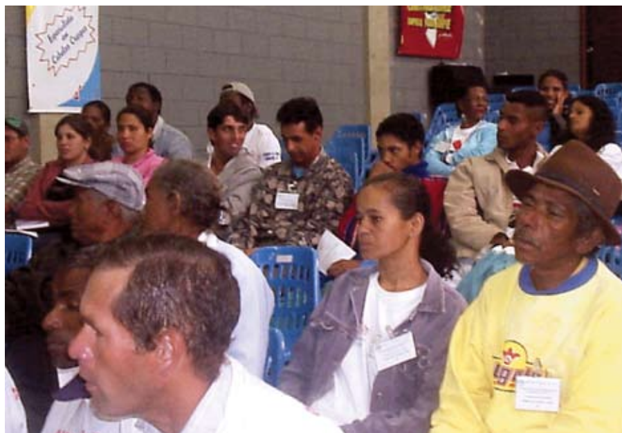
Conteúdo das capacitações aborda o ciclo da cadeia produtiva de reciclagem