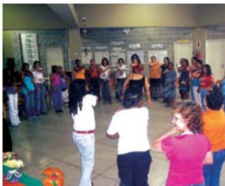
Catadoras do MNCR em espaço de articulação regional

O Convênio prevê a capacitação de 701 lideranças de catadores que contribuirão para a organização da categoria, multiplicando o conteúdo das formações em suas regiões.