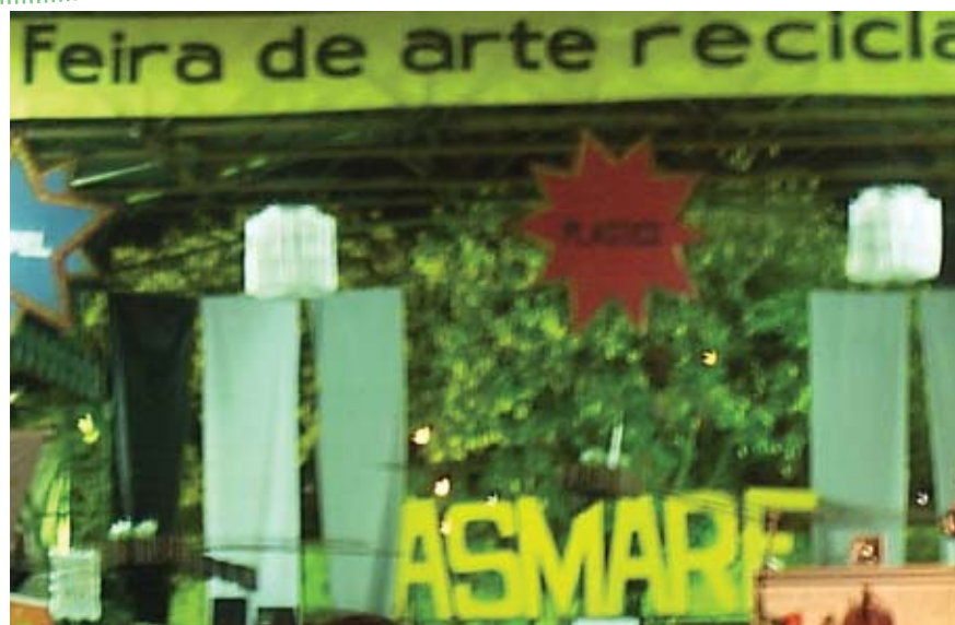
Festival lixo e cidadania em Belo Horizonte, palco para o lançamento da Usina

O MNCR luta pelo fechamento dos lixões, mas com a transferência de todos os catadores que neles trabalham para galpões. É dever do poder público garantir o trabalho para todos.