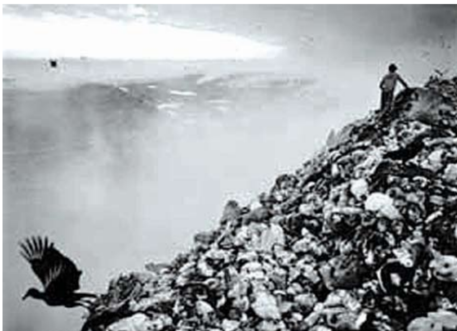
Fotos do documentário "Estamira" sobre aterro de Jardim Gramacho - RJ